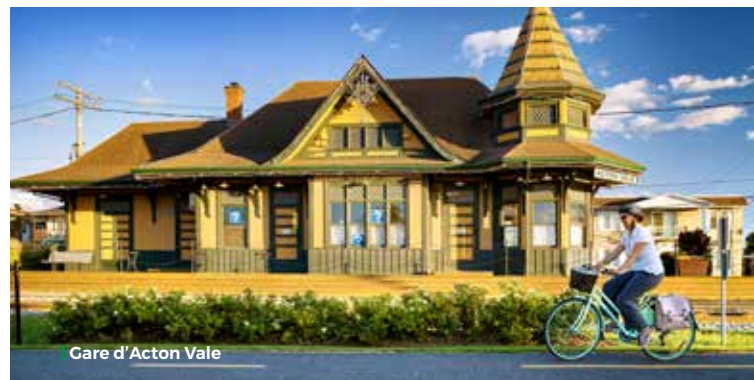
Gare d'Acton Vale

Si vous êtes à la recherche de sérénité, la piste cyclable la Campagnarde vous comblera par l'omniprésence de la nature. De plus, puisqu'elle relie les régions du Centre-du-Québec, de la Montérégie et des Cantons-de-l'Est, les possibilités d'itinéraires sont sans limite.